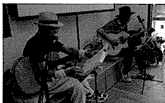
大盛況の弾き語り♪