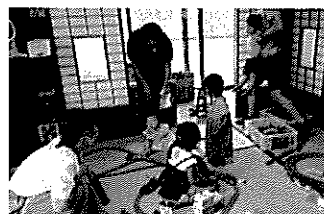
堀江つどいの広場