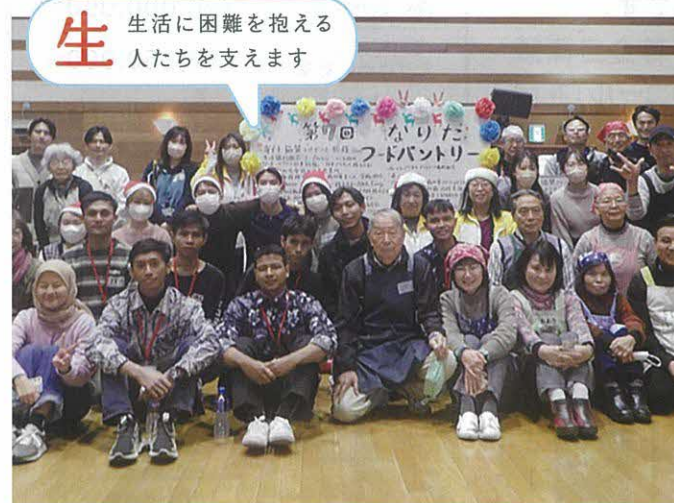
フードパントリー（成田市）