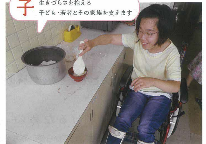
自立生活支援<体験実習>（千葉市）