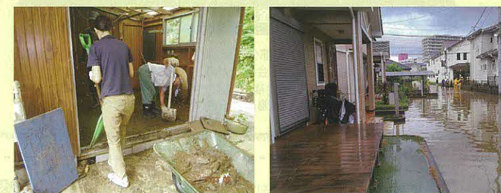
令和5年9月の台風15号接近による大雨災害復興支援