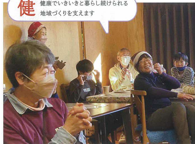
児童デイサービスクリスマス会（山武市）